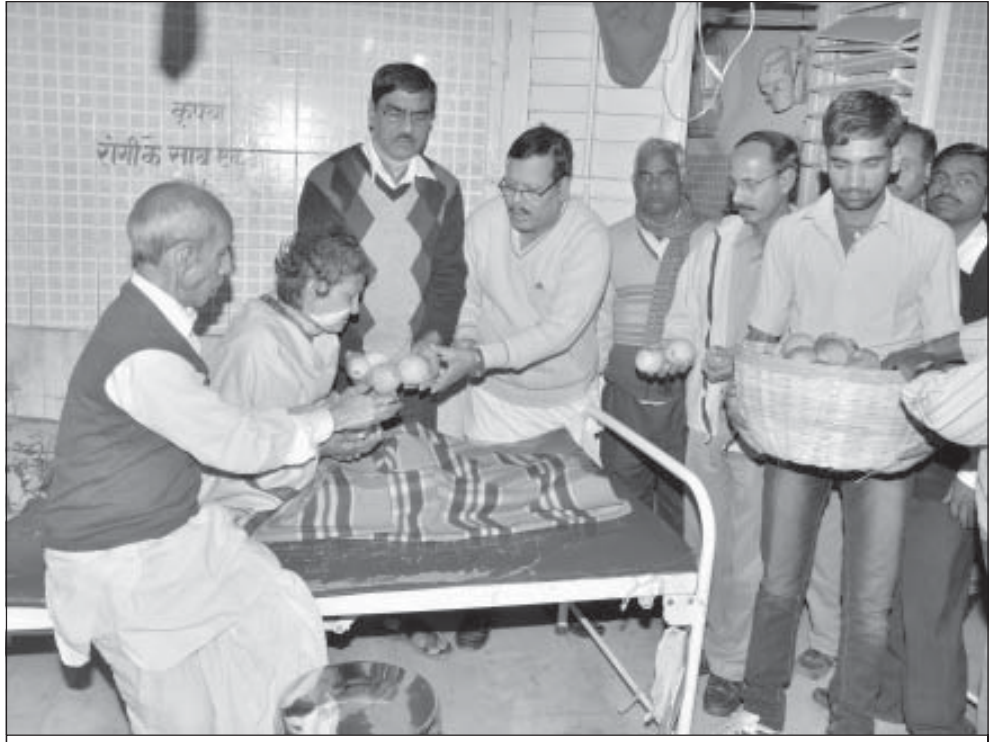
ଦେଓଘର ସଦର ହାସପିତାଳରେ ରୋଗୀମାନଙ୍କ ମଧ୍ୟରେ ଫଳାଦି ବିତରଣ କରାଯାଉଛି