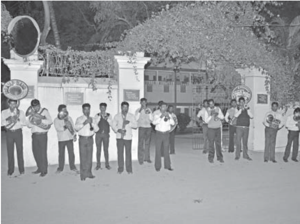
ନିଉ ଗେଷ୍ଟହାଉସର ସମ୍ମୁଖଭାଗେ ବ୍ୟାଣ୍ଟବାଦନରତ ତାରାମା' ବ୍ୟାଣ୍ଟପାର୍ଟି