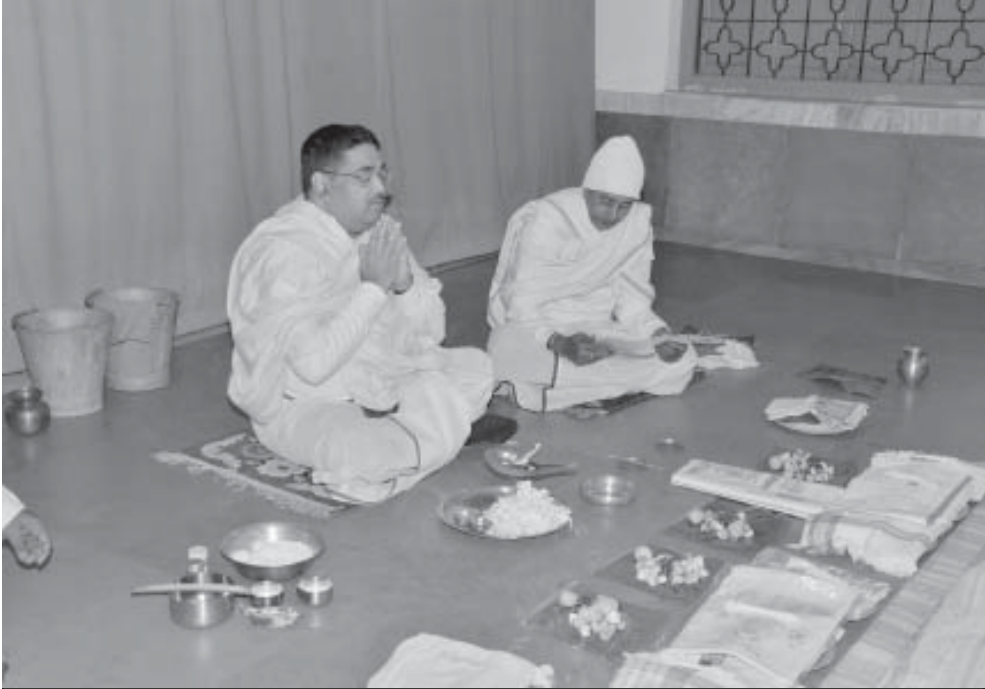
ଠାକୁରବଜାଳାର ଯଜ୍ଞମଣ୍ଡପରେ ପିତୃପୁରୁଷଙ୍କ ଉଦ୍ଦେଶ୍ୟରେ ନାନ୍ଦୀମୁଖ କୃତ୍ୟାଦି ସମ୍ପନ୍ନ କରୁଛନ୍ତି ପୂଜନୀୟ ସିପାଇଦା

ପାଠାନ୍ତେ ପୂଜନୀୟ ବାବାଜୀଦା ଭକ୍ତବୃନ୍ଦଙ୍କ ସହ ଷୋଡ଼ଶୀଭବନରେ ପହଞ୍ଚି ଯୁଗାରାତ୍ମ୍ୟ ପରମପୂଜ୍ୟପାଦ ଶ୍ରୀଶ୍ରୀବଡ଼ଦାଙ୍କ ଶ୍ରୀଚରଣରେ ପ୍ରଣାମ ନିବେଦନ କରି ପରମପୂଜନୀୟା ମା' ଏବଂ ପରମପୂଜନୀୟା ରାଜାମା'ଙ୍କ ଶ୍ରୀଚରଣେ ପ୍ରଣାମ ନିବେଦନ କରନ୍ତି । ତା'ପରେ ଫିଲାନଥ୍ରପା ଅର୍ଫିସ ସମ୍ମୁଖସ୍ଥ ଆଚାର୍ଯ୍ୟ ମଣ୍ଡପରେ ପରମପୂଜ୍ୟପାଦ ଆଚାର୍ଯ୍ୟଦେବ ଶ୍ରୀଶ୍ରୀଦାଦାଙ୍କ ଶ୍ରୀଚରଣରେ ପ୍ରଣାମ ନିବେଦନ କରନ୍ତି । ଉପସ୍ଥିତ ଭକ୍ତବୃନ୍ଦ ତାଙ୍କୁ ଅନୁସରଣ କରନ୍ତି ।