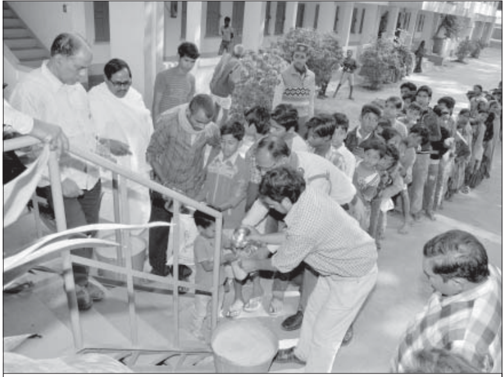
ନିଉ ଗେଷ୍ଟହାଉସ ପ୍ରାଙ୍ଗଣରେ ଦୁଃଖମାନଙ୍କ ମଧ୍ୟରେ ଚାଉଳ, ବସ୍ତ୍ର, ଅର୍ଥ ବିତରଣ କରାଯାଉଛି