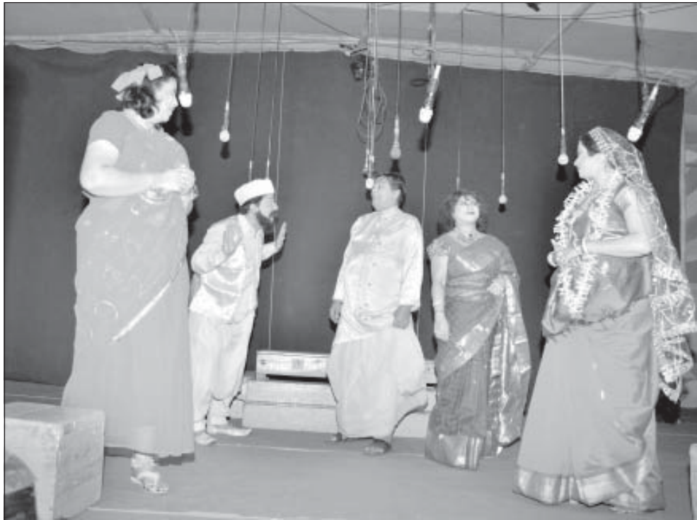
ମନୋମୋହିନୀଧାମସ୍ଥିତ ଉତ୍ସବମଞ୍ଚରେ ଯାତ୍ରାନୁଷ୍ଠାନର ଏକ ଦୃଶ୍ୟ